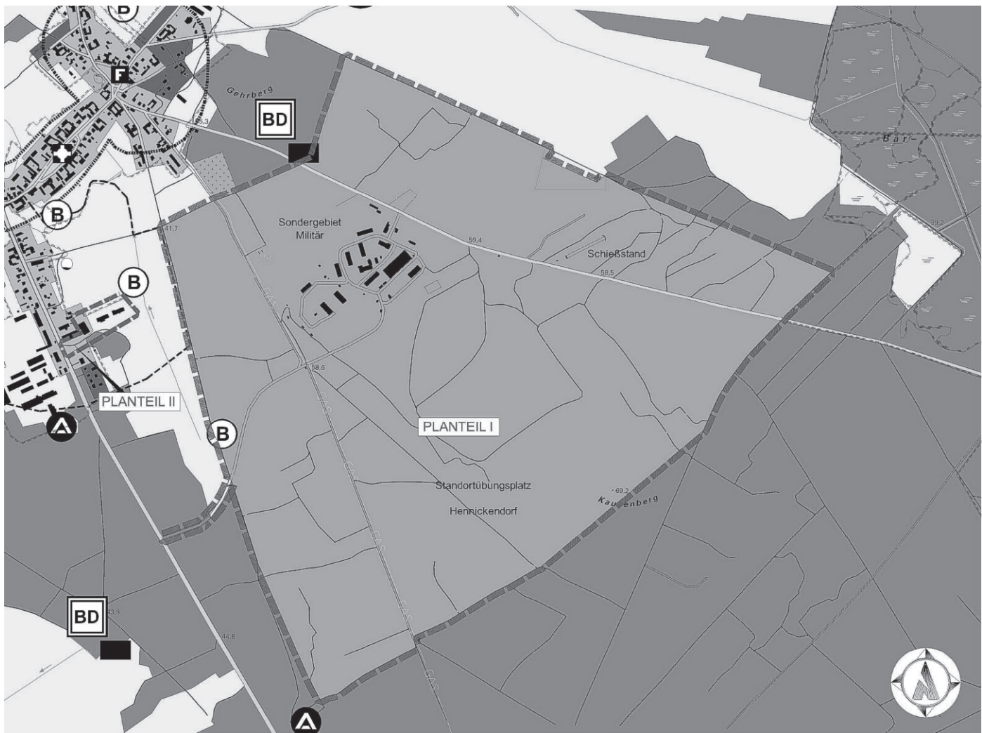
Flächennutzungsplans der Gemeinde Nuthe-Urstromtal (Genehmigung vom 24.09.1998, unter Berücksichtigung der 1. Änderung mit Genehmigung vom 03.03.2006)

Das Änderungsgebiet ist dem folgenden Kartenausschnitt (nicht in Originalgröße) zu entnehmen.