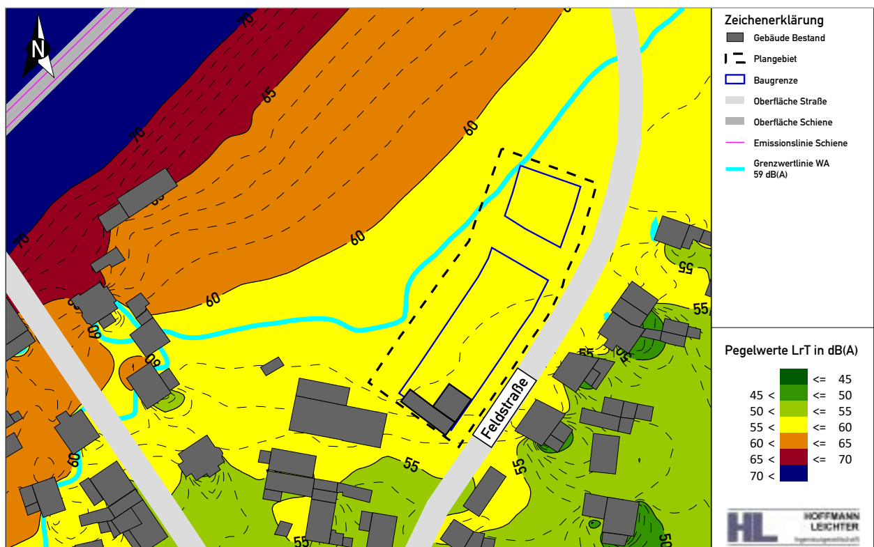
Abbildung 1 Isophonenkarte in 5 m Höhe über Gelände | Beurteilung nach DIN 18005 | tags, 06:00 – 22:00 Uhr

Gemäß Arbeitshilfe Bebauungspsplanung des Landes Brandenburg [14] ergibt sich für die Beurteilung von Außenwohnbereichen ein Immissionswert von 65 dB(A). Abweichend zur Arbeitshilfe Bebauungsplanung sieht die DIN 18005 jedoch eine Beurteilung von Außenwohnbereichen anhand des tageszeitlichen Orientierungswerts der jeweiligen Gebietsnutzung vor. Im Sinne des Lärmschutzes wird im vorliegenden Fall der DIN 18005 gefolgt und auch zur Gewährleistung einer der Gebietsnutzung angemessenen Aufenthaltsqualität im Freien der tageszeitliche Orientierungswert der DIN 18005 als Zielwert herangezogen. Analog zur Beurteilung der Innenbereiche ist jedoch auch im Hinblick auf die Außenwohnbereiche davon auszugehen, dass mit Einhaltung des Grenzwerts der 16. BImSchV eine ausreichende Aufenthaltsqualität für mögliche Außenwohnbereiche sichergestellt werden kann und keine Schallschutzmaßnahmen erforderlich werden. An der in Abbildung 1 4 dargestellten Grenzwertlinie (59 dB(A)) wird ersichtlich, dass der tageszeitliche Grenzwert der 16. BImSchV im gesamten B-Plangebiet unterschritten wird und somit keine Maßnahmen zum Schutz möglicher Außenwohnbereiche im B-Plan erforderlich werden.